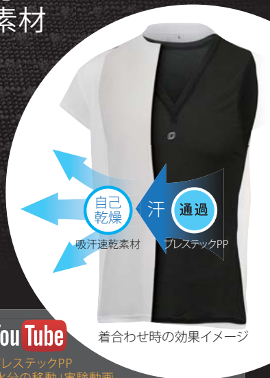
着合わせ時の効果イメージ

ブレステックPPは、「水を含まない繊維」を使用し、「特殊な編み方」により生まれたON·YO·NE独自の開発素材です。素材自体の性能と組織によって、さらとした着用感を実現し持続する画期的なアンダーウェアです。